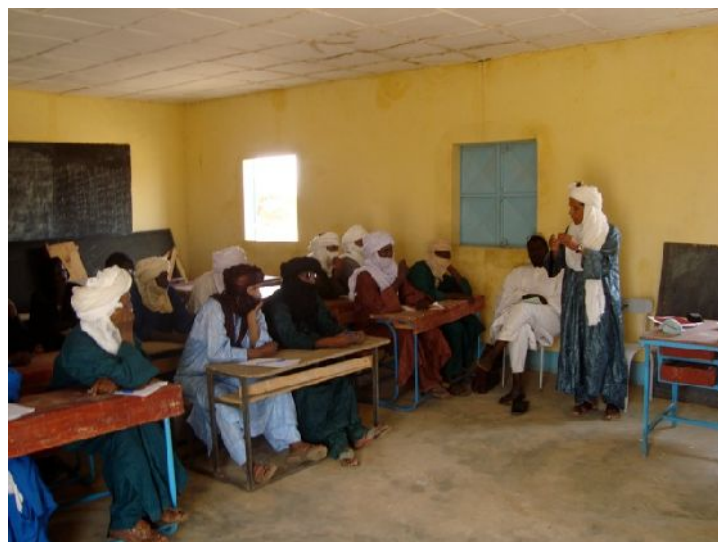
- 2 photos IM -