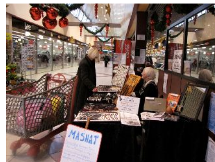
Au centre commercial d'Intermarché à l'Aigle