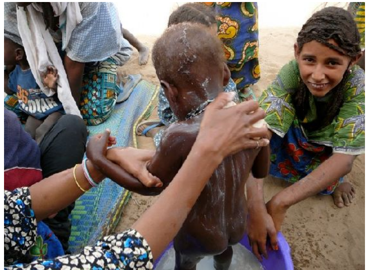
- 4 photos IM