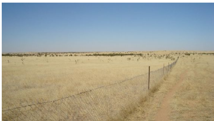
Une « banque fourragère » (réserve d'herbe sur pied) nouvellement clôturée