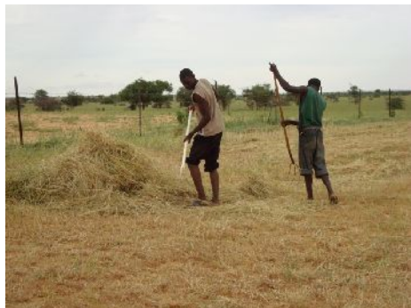
Les bergers s'initient au maniement des pelles et des râtaux