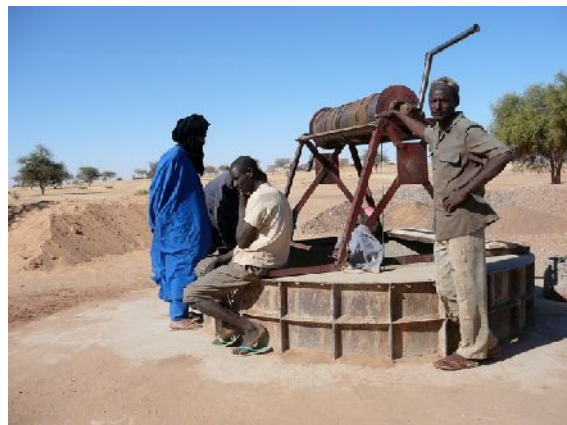
- 3 photos IM -