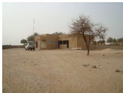
- 2 photos IM -