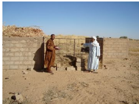
Un « auditeur » d'Areva constate que les aires de stockage sont pleines