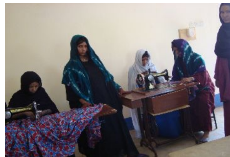
- 6 photos IM -