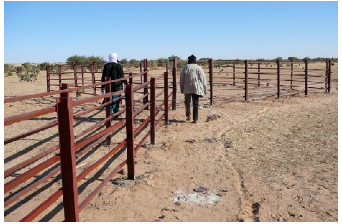
- 2 photos IM -