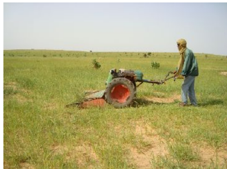
La faucheuse en action

Depuis fin 2010, une quasi auto-suffisance en eau et en aliments permet ainsi à la Ferme d'être techniquement et financièrement opérationnelle. Aujourd'hui 90 litres de lait de vache sont, en moyenne, mis en vente, chaque jour, sur le marché d'Abalak.