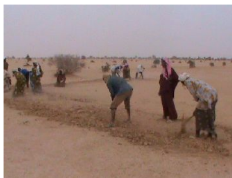
- 2 photos IM -