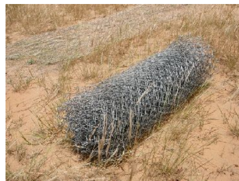
Un grillage plus efficace que le barbelé

La Ferme de chameilles est aujourd'hui opérationnelle. La clôture, le puits profond (le puits n°2 d'in Idbig) sont réalisés et les 40 chameilles sont dans le nouvel espace. C'est du concret. La production laitière est de 20 à 25 litres par jour.