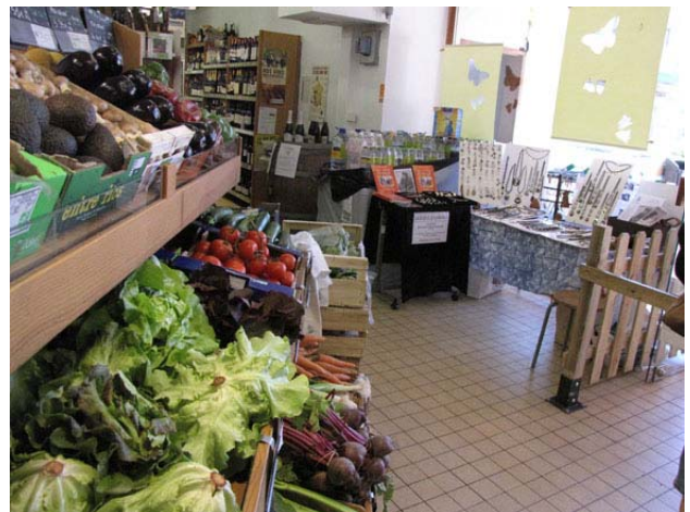
Les amis du magasin Fréquence Bio de Caen ont aimé l'animation créée par le stand Masnat