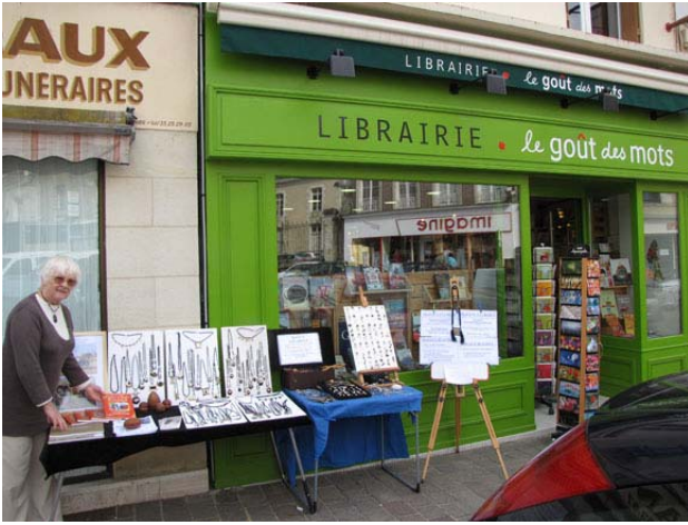
L'ami libraire de Mortagne était heureux de la boutique Masnat