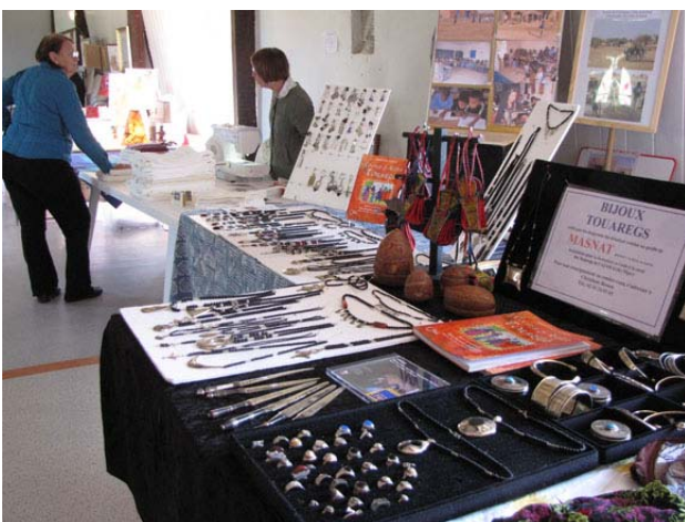
A l'expo artisanat de la Chaise Dieu du Theil