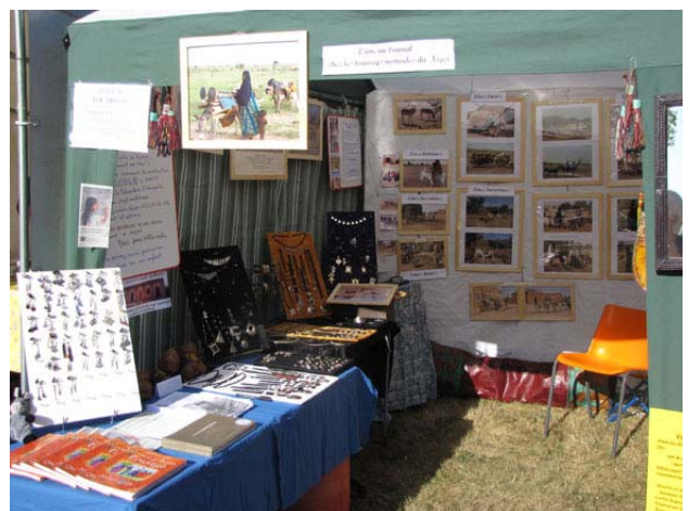
La boutique Masnat à Festiv'âne de la Comtesse de Ségur à AUBE : thème « L'âne touareg »