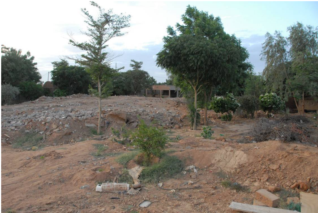
De « LA TENDE » il ne reste que la terrasse du restaurant (au fond) et les toilettes (à droite) qu'Ibrahim avait construites en béton.