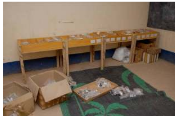
Installation en cours du nouveau magasin