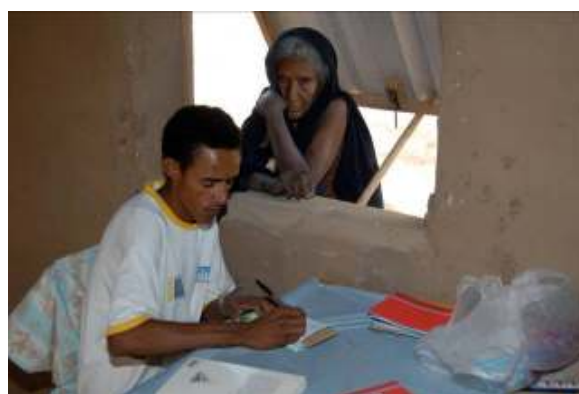
Un guichet d'accueil a été installé à la fenêtre de la salle des soins