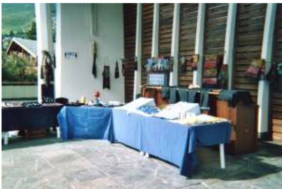
Sur le parvis d'une église avec nos amis suisses près de Martigny