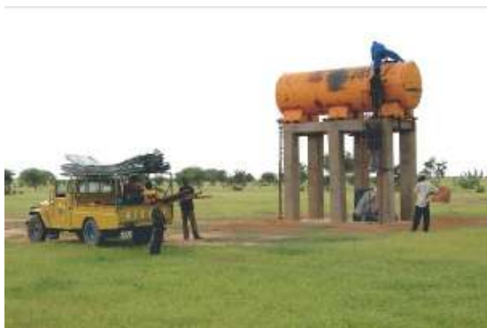
Mise en place de la citerne

Le premier remplissage de la citerne de 10 000 litres s'est fait en moins de 3 heures fin octobre 2008. Le tout doit être opérationnel au plus tard dans deux ou trois semaines lorsque l'eau des mares toutes proches sera épuisée.