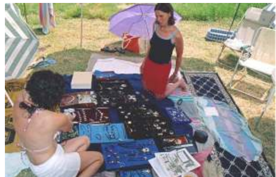
Dans un camping en Corse