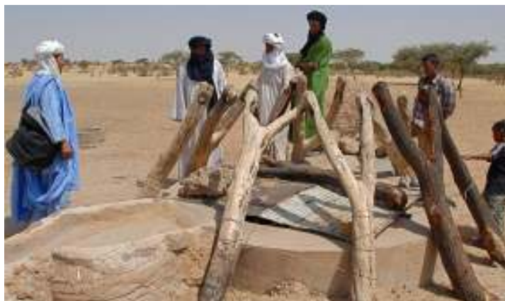
Le puits, prêt pour l'exhaure animale en 08/09, se prépare pour l'exhaure mécanique au 2 ème semestre 2009