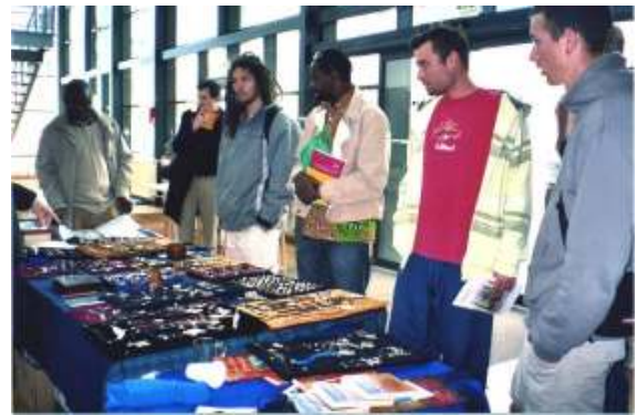
A la fête des Partenaires à l'Institut de Géographie Alpine