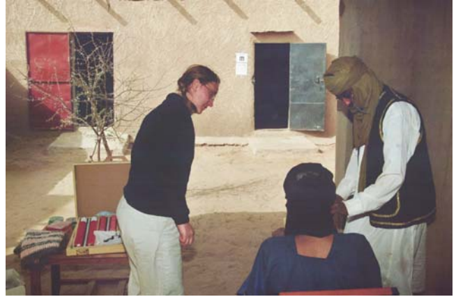
Analyse de vue à Chin Fangalan