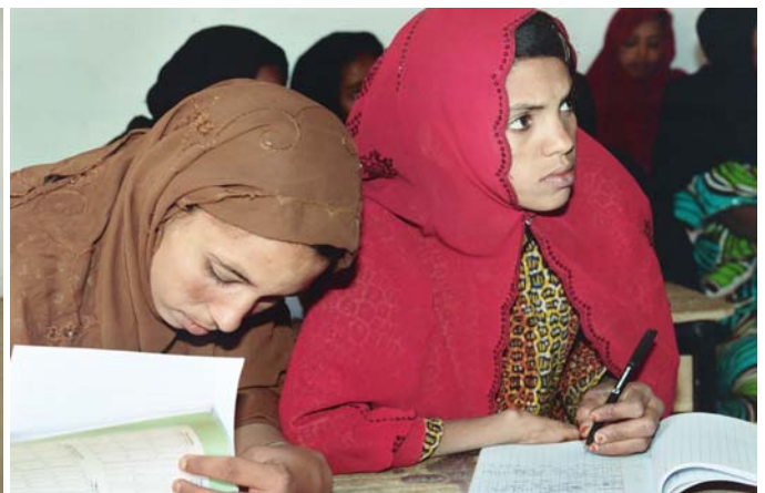
Merci pour les cahiers : c'est plus facile que les ardoises !