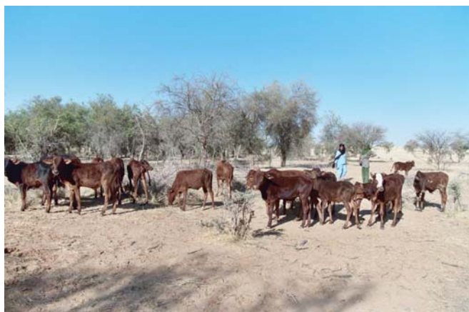
Les premiers veaux de la ferme

Pour ceux qui voudraient encore participer, la souscription n'est pas close : bulletin ci-après