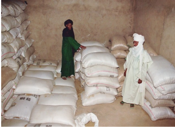
Acquisition des premiers sacs de son