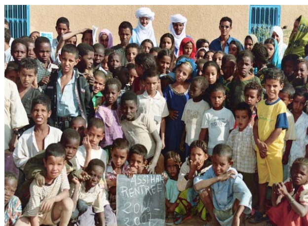
La promotion 2006/2007