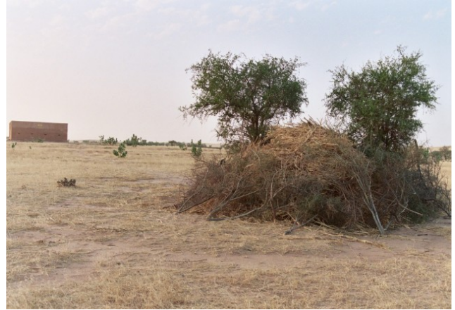
Premier stockage de fourrage (tiges de mil)