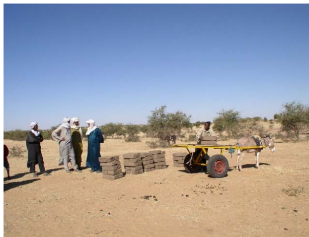
Les charrettes apportent les premières briques