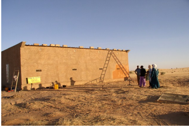
Le magasin de stockage des aliments du bétail