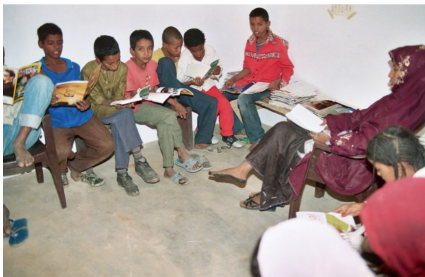
Une salle de lecture improvisée ...