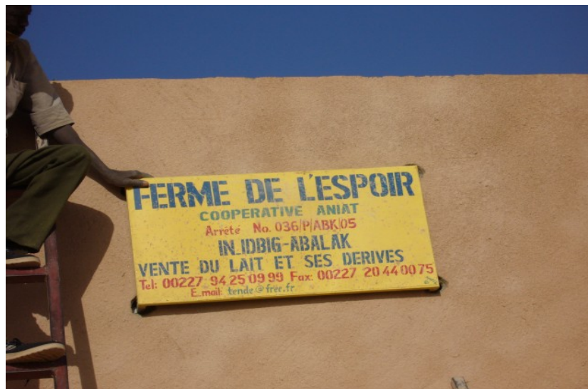
Accrochage du premier panneau ...