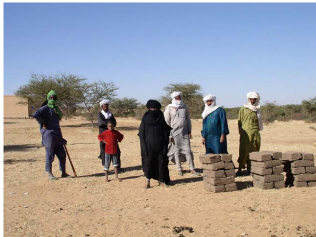
Les anciens du village ont décidé de l'emplacement

La maisonnette de l'instituteur de l'école de Chin Fangalan est très petite et très rudimentaire ; de plus elle est fort mal placée au centre de la grande place du village. Masnat a donc décidé de construire une petite maison en terre non loin de l'école, à côté de la case du chef de village. Cette dépense d'environ 2000 € avait été inscrite par le Bureau du 15 octobre 2006 à l'avant-projet de budget 2007. Pour profiter de l'eau de la mare qui sera épuisée début décembre, les artisans locaux ont commencé à fabriquer, dès début novembre, les quelque 4 000 briques en terre nécessaires à la construction.