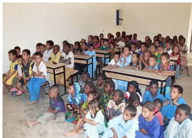
La place commence à manquer ...