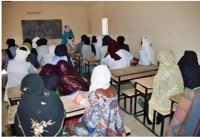
Formation des Comités de Gestion