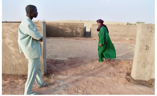
Le parc de vaccination est prêt